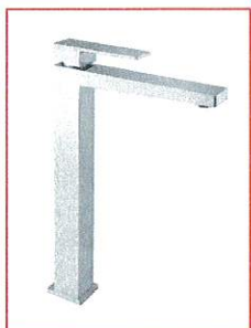
Miscelatore lavabo alto, scarico click clack, flex antitorsione 70 cm 3/8"F