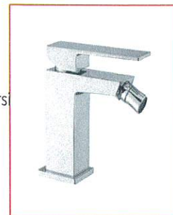
Miscelatore bidet, scarico click clack, flex antitorsione cm 3/8"F