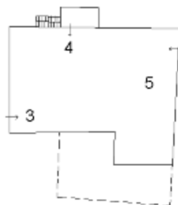
PIANO 1° SOTTOSTRADA (piano seminterrato)